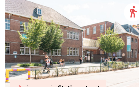
→ ingang via Stationsstraat