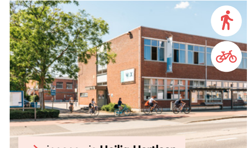
→ ingang via Heilig Hartlaan